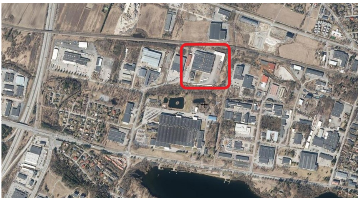
Kuva 1. Selvitysalueen sijainti rajattu punaisella (ilmakuva MML)

Geopalvelu Oy teki kohteessa pintavaaituksen ja olevien sadevesiviemäröintien kartoitusta. Käytössämme oli arkkitehdin pihasuunnitelmakuva. Pohjaolosuhteiden osalta tukeuduimme Geologian tutkimuskeskuksen pohjatutkimusrekisteriin ja maaperäaineistoihin.